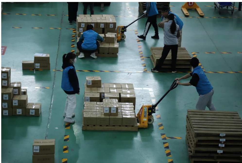
参赛学生比赛现场

高职市场营销技能赛项共颁发一等奖8个，二等奖6个，三等奖24个。其中，我校斩获一等奖（第1名）1个，二等奖1个。高职智慧物流作业方案设计与实施赛项共颁发一等奖4个，二等奖8个，三等奖11个。其中，我校参赛的两个队伍均获一等奖，分别是一等奖（第1名）、一等奖（第2名）。