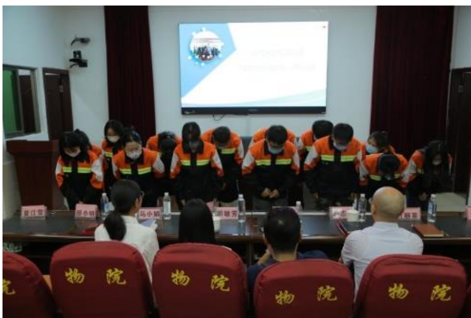
图6 现代学徒制人才培养

《深耕现代学徒制，筑高质量发展之路》已入选教育部产教融合校企合作典型案例，为全国高职院校学徒制模式的开展提供了可借鉴经验。